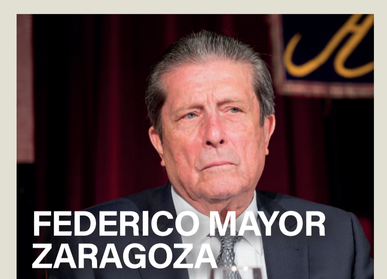
FEDERICO MAYOR ZARAGOZA